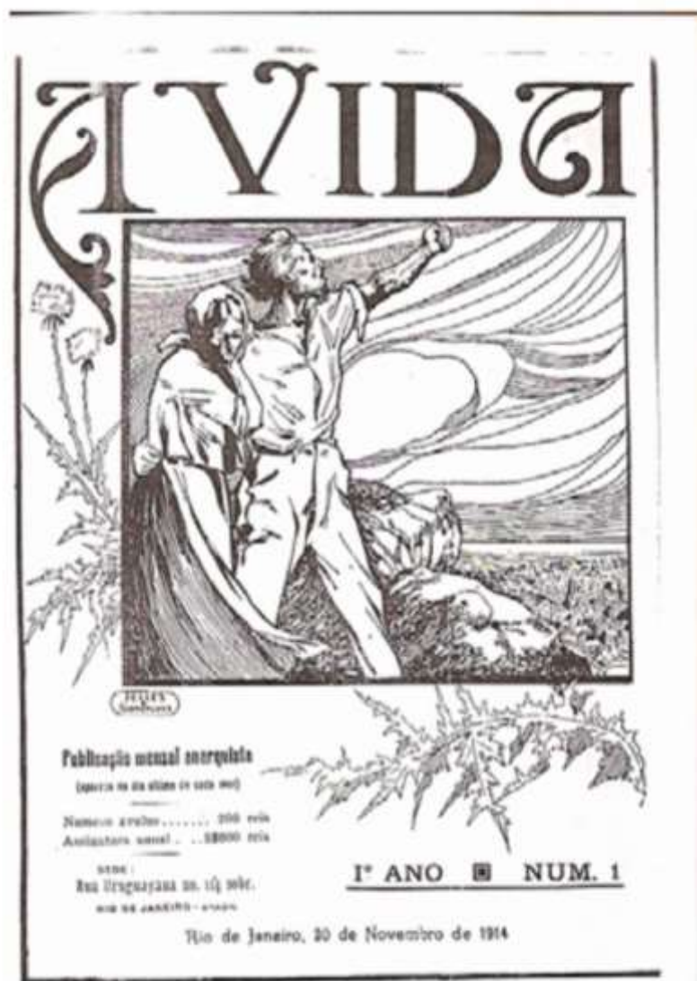
Figura 1 – Capa da Revista “A Vida”